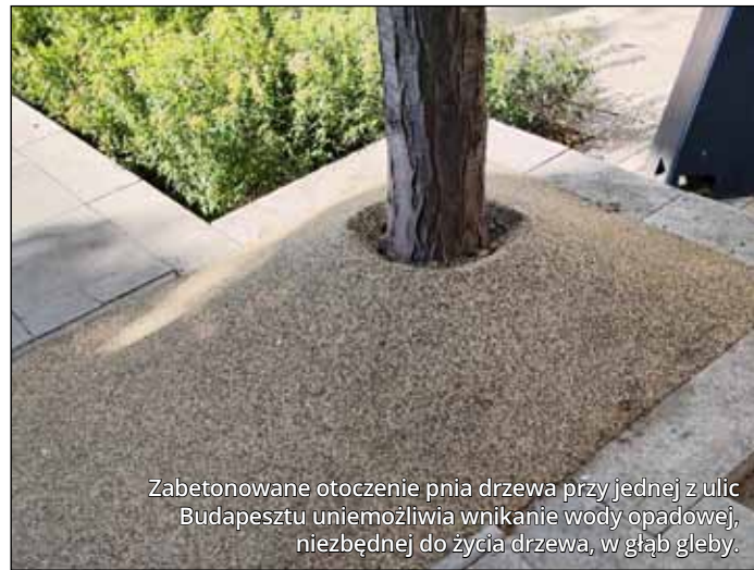
Zabetonowane otoczenie pnia drzewa przy jednej z ulic Budapesztu uniemożliwia wnikanie wody opadowej, niezbędnej do życia drzewa, w głąb gleby.

Coraz częściej słyszymy o suszy, coraz częściej widzimy jej skutki. Zmiana klimatu sprawia nie tylko, że odnotowuje się coraz wyższe średnie temperatury, lecz także rzadsze a gwałtowne opady. Te zaś natrafiają na wyschniętą ziemię i spływają po jej powierzchni, w niewielkim tylko stopniu wnikać w głąb niej. Ilość wody dostępnej dla roślin jest zatem niewielka, zwłaszcza latem. Kurczą się również zasoby wody pitnej. Czy możemy pomóc przyrodzie, naszemu ogródkom i nam samym w prze-