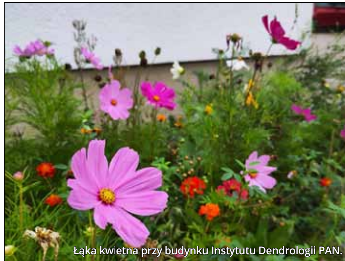
Łąka kwietna przy budynku Instytutu Dendrologii PAN.

łoża np. rozchodniki, wrzosy czy lawendę, a spośród gatunków drzewiastych jałowiec lub sosnę (np. formy karłowate). Pozwoli to dodatkowo zaoszczędzić cenną wodę, której inne gatunki potrzebowałyby znacznie więcej.